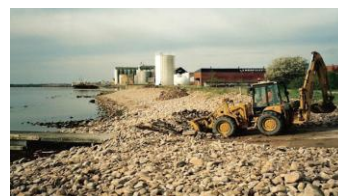
for mange sten