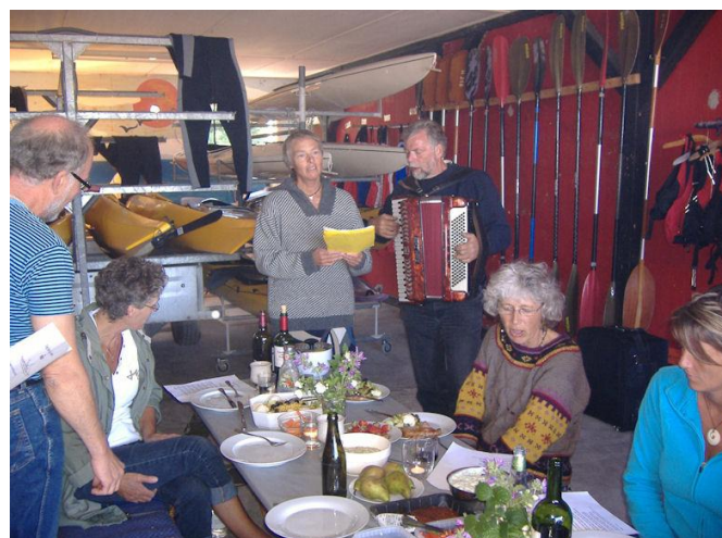
Grillaften med levende musik