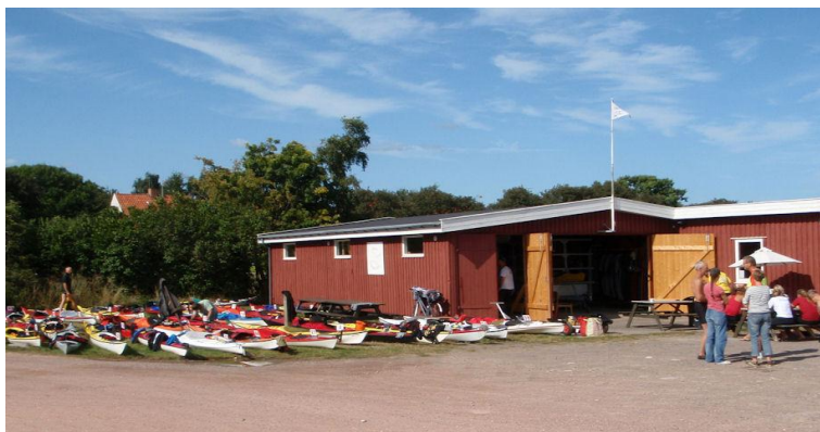
Klubhuset under Seachallenge Bornholm 2009