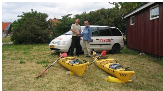
En repræsentant fra Tuborg overdrager "Hugin" og "Munin" - to Seayak'er fra Prijon