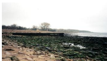
For lidt vand