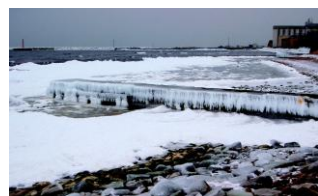
for meget is og sne