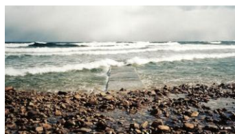
for meget vand