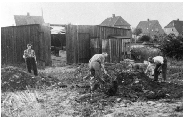
De to barakker med tipvognsspor imellem

3. maj 1951. Det ligger indenfor strandbelyttelseslinjen og har en vis historisk værdi. Det er ikke decideret fredet, men det er underlagt visse restriktioner, således at det udvendigt skal fremstå som originalt. Grunden lejes gratis af kommunen, og det omgivende område er underlagt Naturstyrelsens og Kystdirektoratets myndighed.